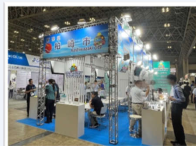
第30回出展時の様子