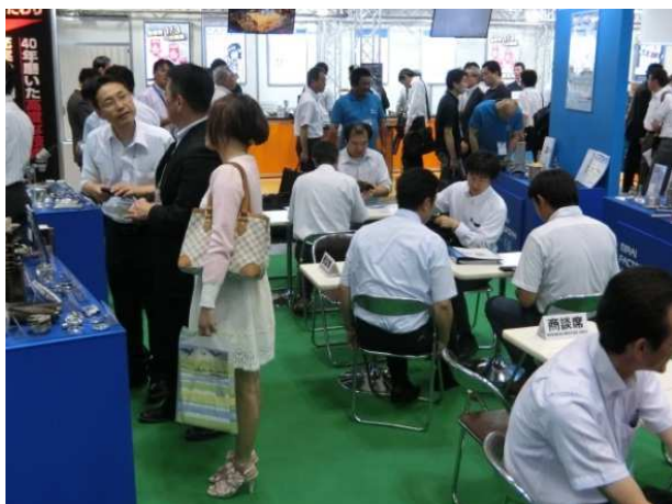
出展時の様子（2016 東京）