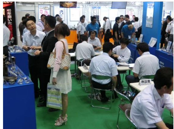
機械要素技術展 2015 の様子